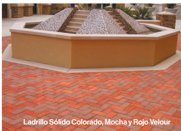
Ladrillo Sólido Colorado, Mocha y Rojo Velour