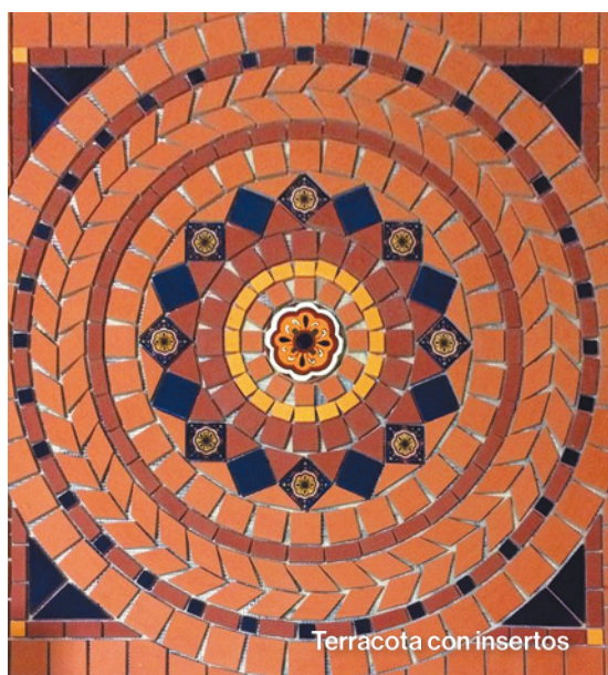
Terracota con insertos